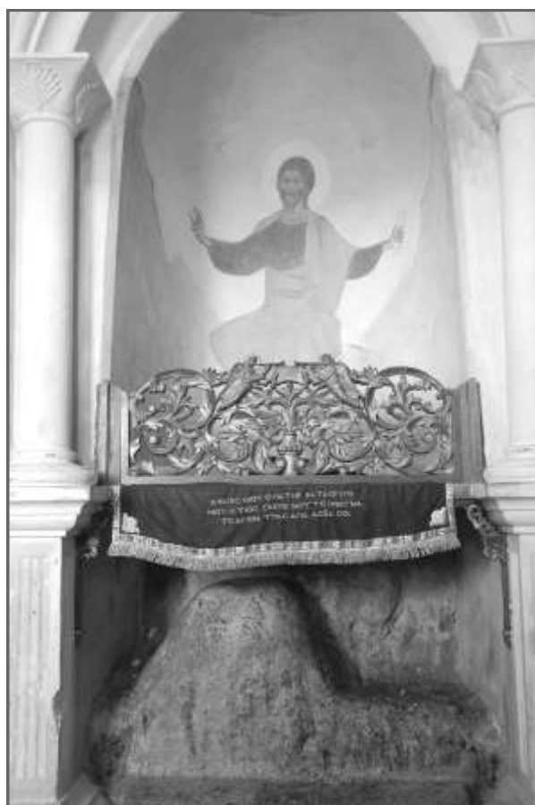
Камень, на котором молился Христос на горе Искушений