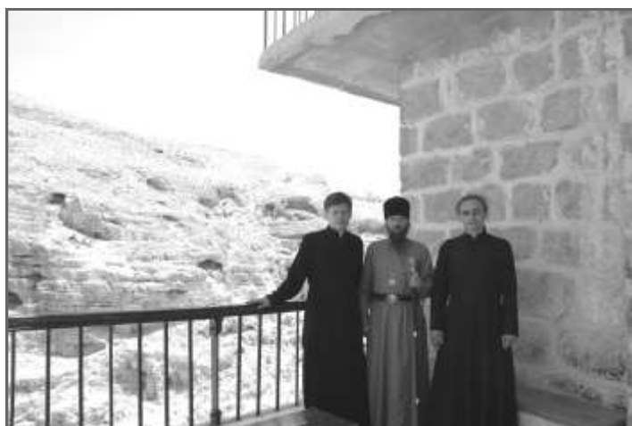
В Лавре Саввы Освященного на фоне древних пещер