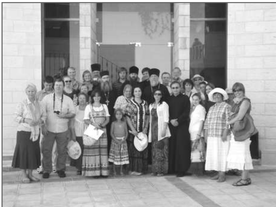
Вифлеем. Перед входом в гостиницу.