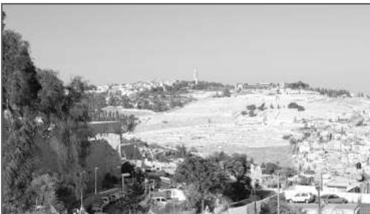
Русская свеча на вершине Елеонской горы - одна из доминант Иерусалима