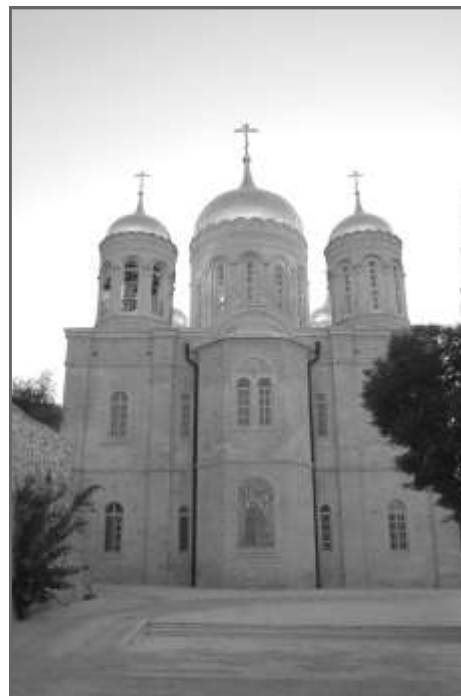
Горненский монастырь. Собор в честь Всех Святых в земле Российской просиявших