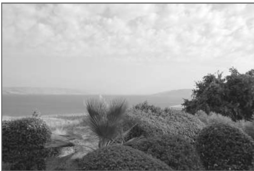
Вид на Галилейское море с Горы Блаженств