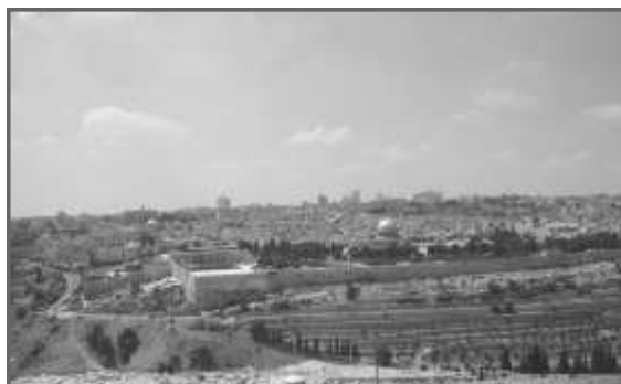
Панорама старого города Иерусалима