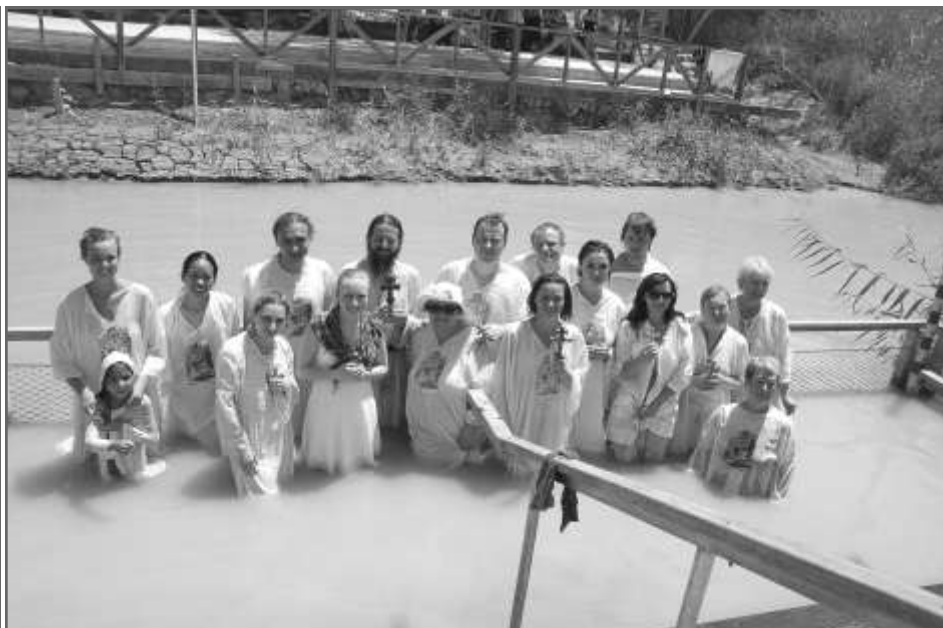
На Иордане на месте, где крестился Спаситель